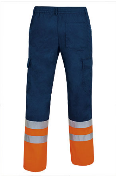
Vista parte trasera de la prenda