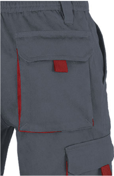
Detalle bolsillo lateral