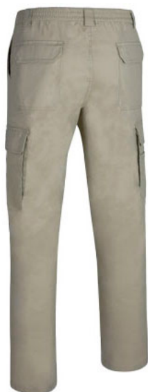
Vista parte trasera de la prenda