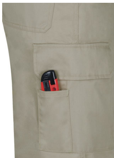
Detalle bolsillo lateral con departamento para cutter