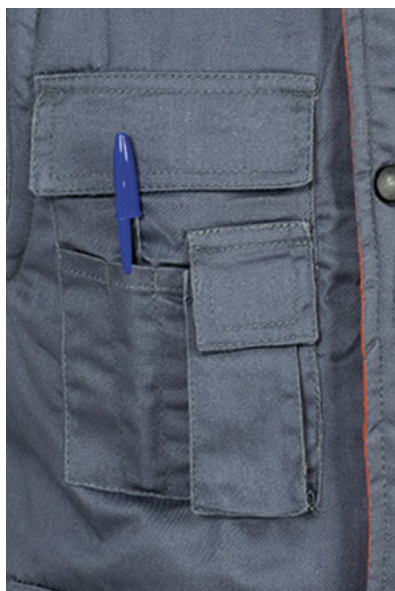
Detalle bolsillo en pecho derecho