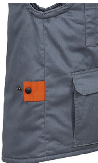
Vista lateral: espalda más larga