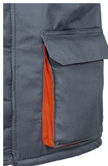
Detalle bolsillo con fuelle a contraste