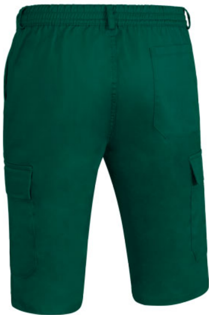
Vista parte trasera de la prenda