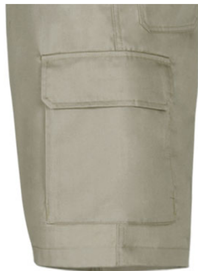
Detalle bolsillo lateral