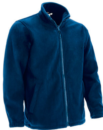
Vista interior tejido polar