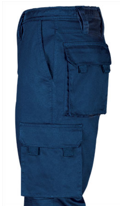
Detalle bolsillo lateral