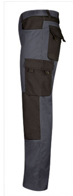
Détail poche latérale