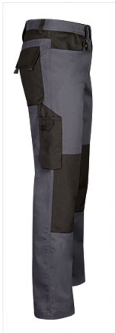
Détail poche latérale avec emplacement pour cutter