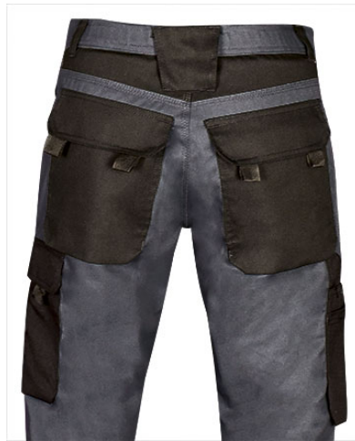
Détail poches arrières