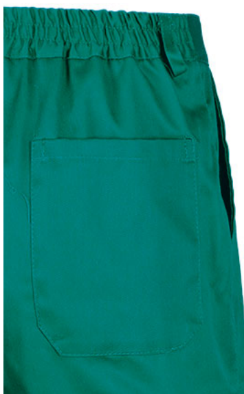
Detalle bolsillos traseros