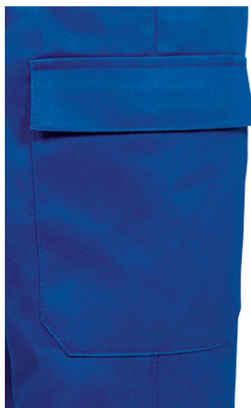
Detalle bolsillo lateral