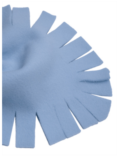
Detalle: esquina redondeada con flecos