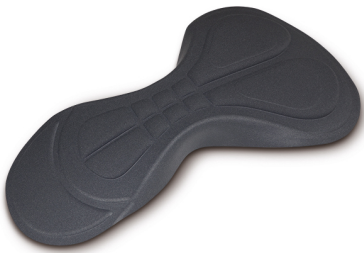
Detalle: badana interior