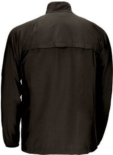
Vista posteriore del capo