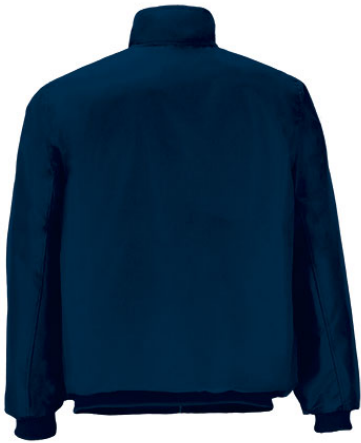
Vista posteriore del capo