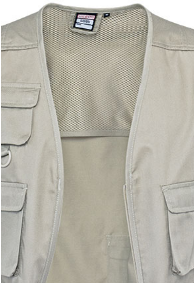
Detalle rejilla interior en espalda (en zona superior)