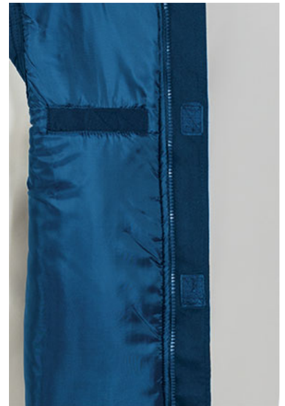
Detalle bolsillo interior en pecho izquierdo