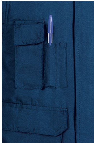
Detalle bolsillo en pecho derecho