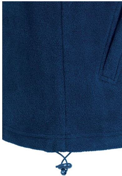
Detalle cordón regulador y freno de ajuste en cintura