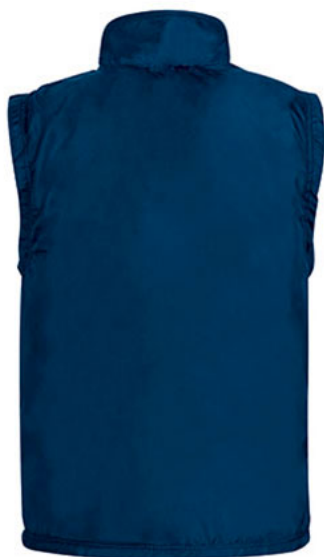
Vista capa tejido hidrofugado