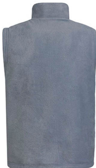
Vista capa tejido polar