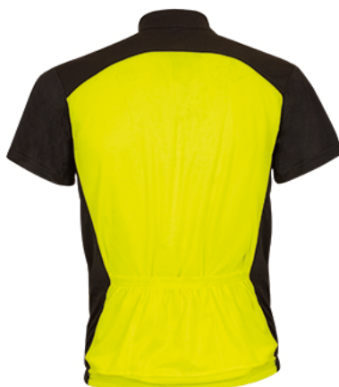
Vista posteriore del capo