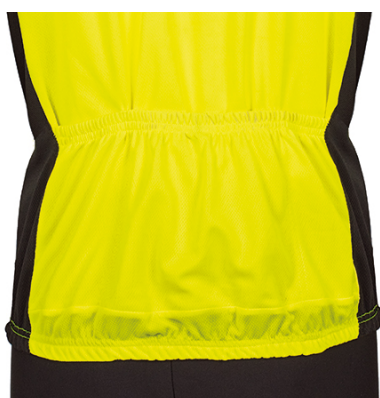
Dettaglio: taschino posteriore