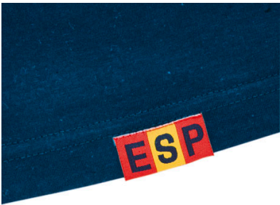
Detalle: Etiqueta bajo delantero