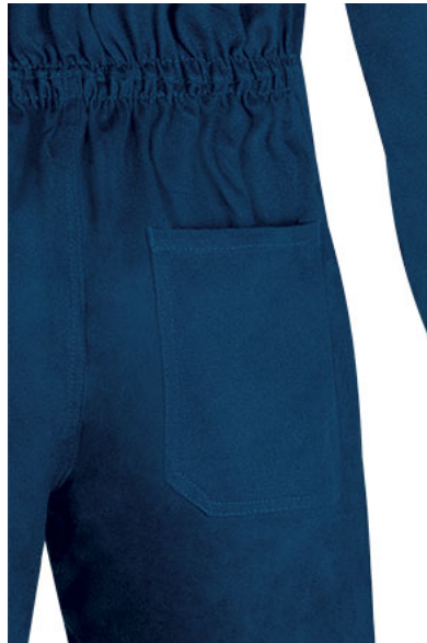
Detalle bolsillo trasero lado derecho