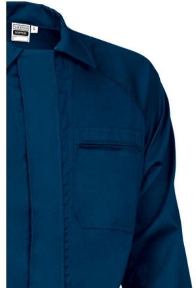
Detalle bolsillo en pecho izquierdo