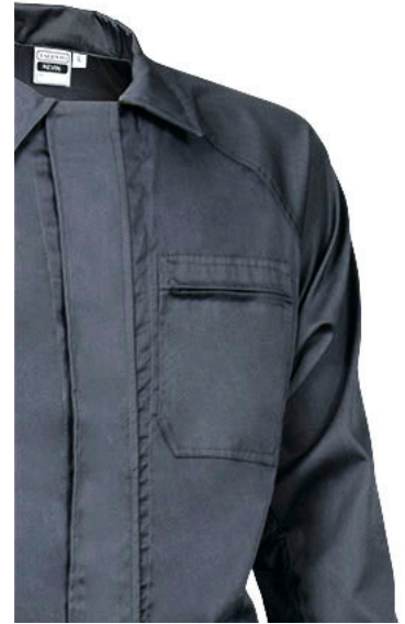
Détail poche poitrine côté coeur