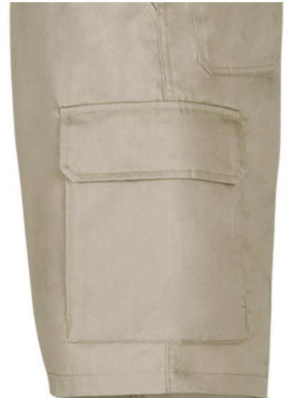
Detalle bolsillo lateral