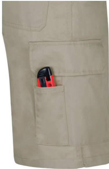
Detalle bolsillo lateral con departamento para cutter